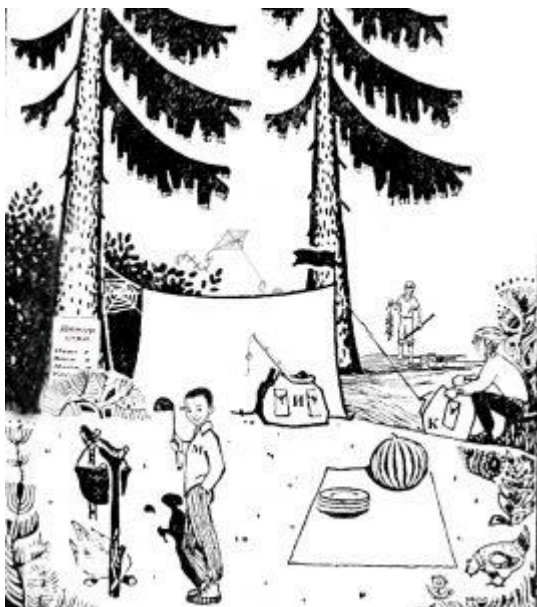
Рис. 1. Рисунок для детектива. 1 этап ролевой on-line игры